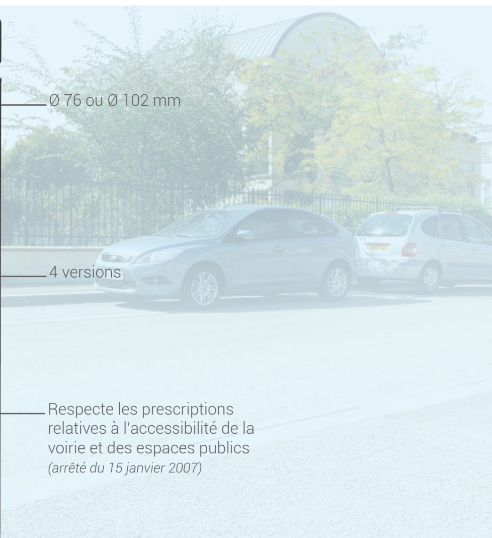
Version standard (monochrome ou bicolore)

Respecte les prescriptions relatives à l'accessibilité de la voirie et des espaces publics (arrêté du 15 janvier 2007)