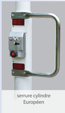
serrure cylindre Européen